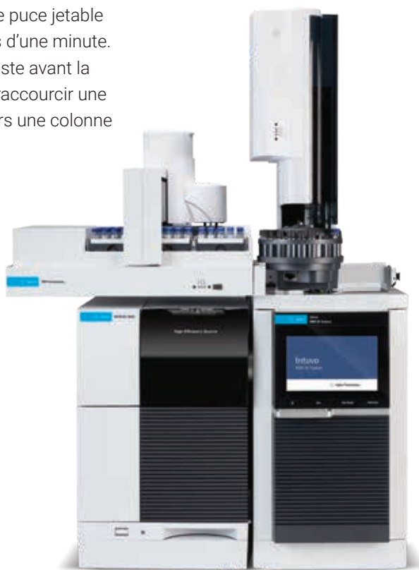
GC Agilent Intuvo 9000 avec Agilent 5977B et passeur automatique d'échantillons 7693

La technologie de colonne de garde Guard Chip d'Intuvo et les colonnes sans coupe fonctionnent de concert. Guard Chip est une puce jetable qui peut être installée et remplacée facilement en moins d'une minute. Cette dernière offre une protection d'environ un mètre juste avant la colonne GC Intuvo. Vous n'aurez plus jamais besoin de raccourcir une colonne. Ainsi, une colonne de 15 mètres restera toujours une colonne de 15 mètres. Fini les décalages de pics !