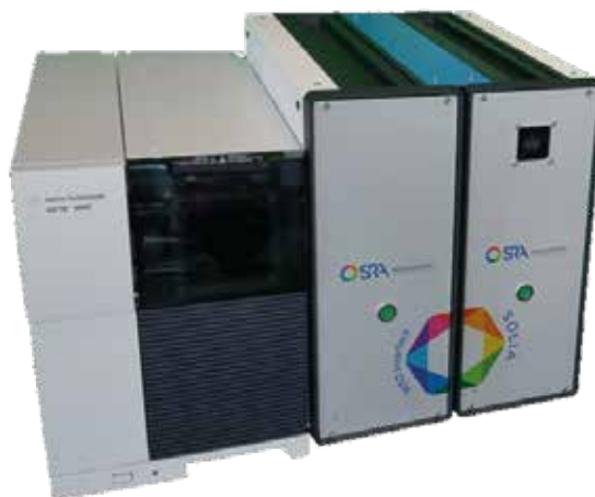
MicroGC SOLIA / MSD

La plupart des composés sont détectés par le détecteur microcatharomètre dans une plage de concentration allant de 1 ppm à 100 % avec une très bonne linéarité. Le couplage au spectromètre de masse améliore la sensibilité jusqu'à 50 ppb voire moins.